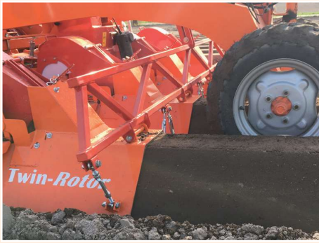
Twinrotor met Super Ridger