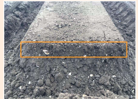
Fijne verkruiemeling toplaag