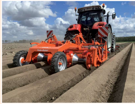
Twinrotor met diabolrol